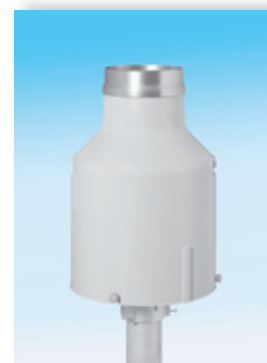
OTT Pluvio 2 400