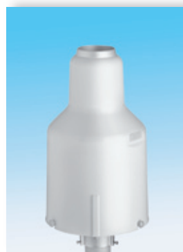
OTT Pluvio 2 200

Les deux variantes peuvent être munies en option d'un chauffage de la bague collectrice.